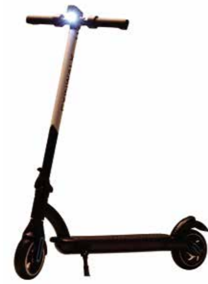
Elektrisk Scooter Nitrox M8